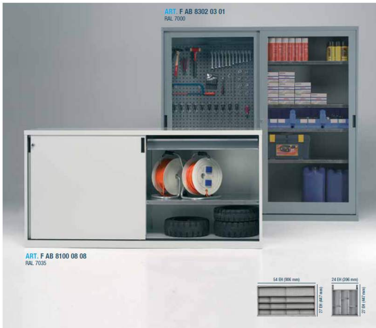
ART. F AB 8302 03 01 RAL 7000

LUNGHEZZA = 2046 mm PROFONDITÀ = 600 mm (54x27 Eh / 24x27 Eh)